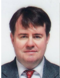
ジョン・ミドルトン教授

開催日時 平成 28 年 1 月 30 日（土）・31 日（日） 開催場所 1 日目：富山国際会議場 2 日目：富山大学経済学部 7 階大会議室 総合司会（オーガナイザー） 富山大学経済学部 准教授 神山智美 参加費等 入場無料